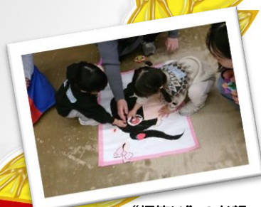
“福笑い”のお顔 上手にできたよ！