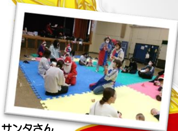
サンタさん プレゼント ありがとう♪