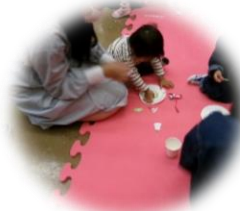
クリスマスリース 上手にできたよ♪