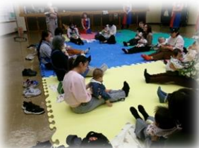
ママのおひざのうえ、 すこ〜く、あんしん!!