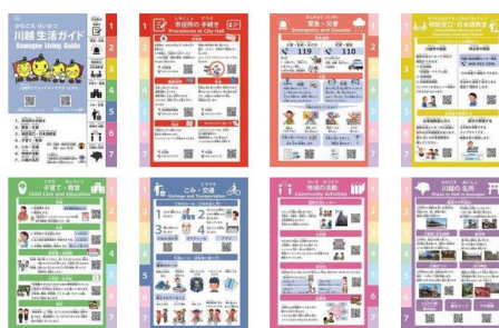
かわごえせいかつ 川越生活ガイド