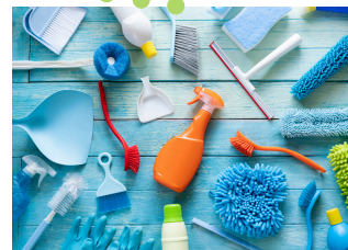
構成企業B（維持管理担当）

「自産自消のできる社会」を理念に、多数の農園管理実績があります。本農園の栽培指導や講習会、体験プログラム等のイベントを担当します。