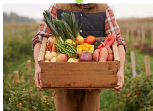
構成企業A（農園担当）

全国で農業公園等の指定管理を多数手がけ、おもてなしの心で接客・広報を統括します。