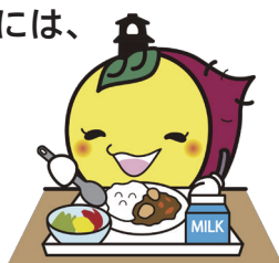
バランスのよい食事