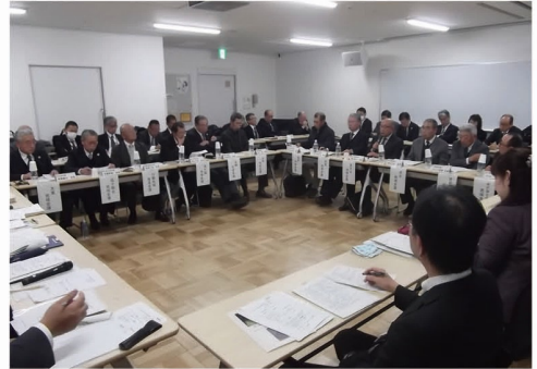
地域会議会長連絡会議・意見交換会