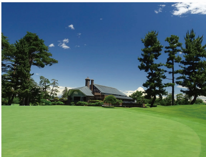
霞ヶ関カンツリー倶楽部 東京 2020 オリンピック・ゴルフ競技会場