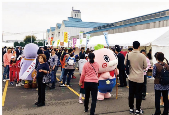
レインボー交流事業