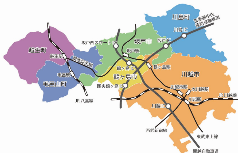
埼玉県川越都市圏まちづくり協議会 (川越市、坂戸市、鶴ヶ島市、川島町、毛呂山町、越生町)