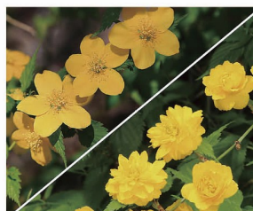
■市の花 山吹 (やまぶき) (昭和 57 年制定)