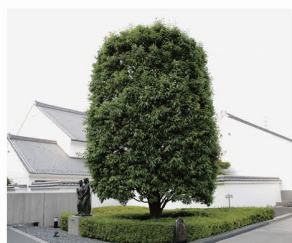
■市の木 かし (昭和 57 年制定)