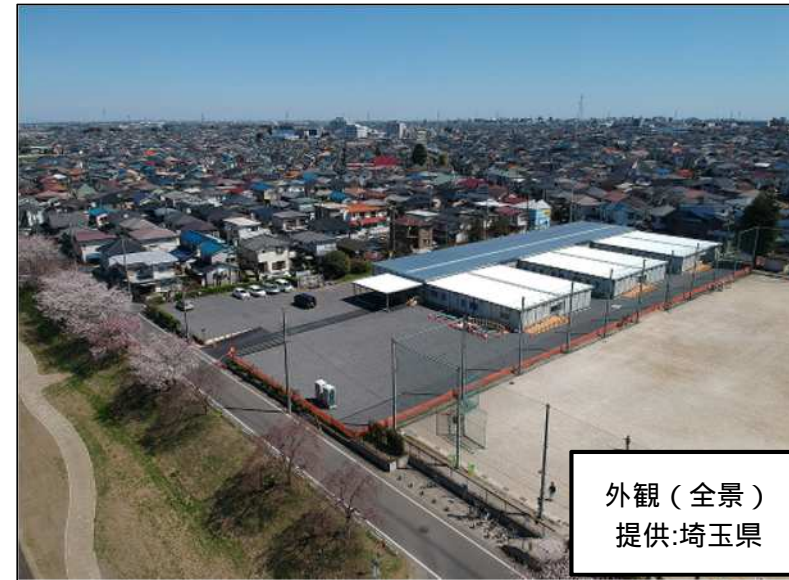
外観(全景)