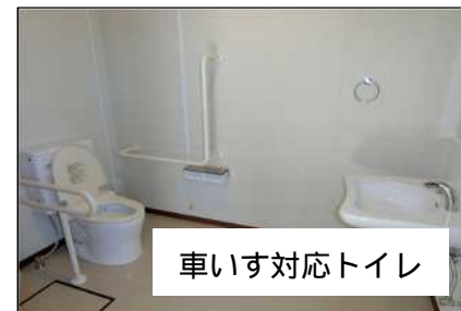
車いす対応トイレ