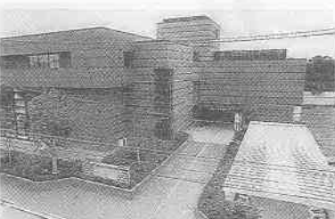
三久保町2-9 ☎22-0559 休館=月曜・祝日・月末