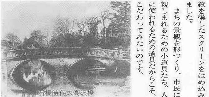
石橋時代の高沢橋

人間として確かな生き方をするために 「我が身をつねって、人の痛みを知れ」という言葉があります。今こそ一人一人がもう一度、自分の無責任な言葉や行動で人の心を傷つけていないかどうかを、考えてみるのが大切ではないでしょうか。差別を見抜くきびしい目と、それをやめさせる実践力をもつ、心の広い人間になるように、私は努力していきたいと思っています。(県同和教育課刊行人権文集「はばたき」第七集から引用)