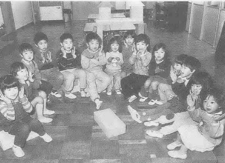
友だちと仲良くお歌の練習 (むさしの保育園)

昭和54年10月の放送開始から数えて7年半、約390本の番組を放送してきた市テレビ広報番組「わが街川越」。市内のいろいろな出来ごとなどを映像化して、毎週火曜日に二回、皆さんのお茶の間にお届けしてきましたが、4月からは、放送局（テレビ埼玉）の番組編成上、放送時間が変更されることになりました。毎週火曜日の二回放送は同じですが、一回目の放送は午後5時30分から10分間、二回目は午後10時から10分間、となります。