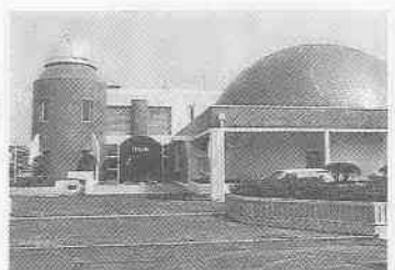
石原町1-41-2 ☎25-7288 休館=月曜・祝日