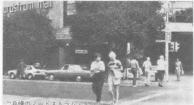
ご自慢のノードストラム・モール

さらに、三年前から始めた街頭二度目の受賞となりセーレム市民行政が協力して推進したことが、