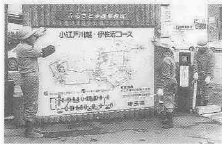
▲塗装が始まった案内板・道しるべ

るべや案内板があり訪れる人々の手助けとなっています。しかし、これらも設置後数年を経たために傷みもひどく、中には文字がよく見えないものも目立ち始めました。そこで、県では九十一あるこれらの施設を全て点検。三月末までに取り替えるべきものは取り替えて塗り替えることになりました。埼京線の開通によって一段と都心へ近くなったわが街川越。テレビ、マスコミでも日帰り小旅行としてたびたび紹介されています。道しるべの化粧直しを機会にあなともふるさと・川越の道を訪ね歩いてみては。きつとすてきな出会い、再発見があるでしょう。