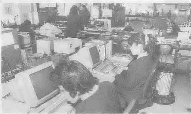
1月5日からスタートした窓口事務のオンライン・サービス

特に、昨年は市民生活に欠くことのできないごみ処理施設、東清掃センターが新たに完成いたしました。