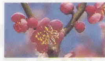
市民文化祭 短歌大会から