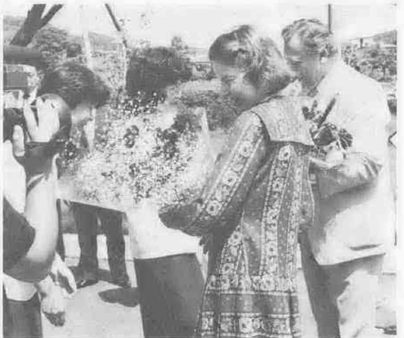
（ジョージニアリス駐日ギリシア大使夫妻が棚倉町を訪問）

この国際化へ対応できる町づくりは、他の施策に先がけて進めており、すでにその話題が盛りあがっています。 ともに北緯三十七度に位置し、オリンピック発祥の地、ギリシャ共和国のスバル市との間で、来年九月二十三日に国際友好都市提携が正式に調印されます。 昭和六十五年の春にオープンする予定の総合リゾート・スポーツプラザ「ネサンス棚倉」の構想がありませんが、その施設の一部に早くもギリシア様式を取り入れるなど、今後はスポーツや文化の交流を通じて国際性豊かな人づくり、町づくりを進めていきます。