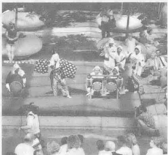
「ハヤシバンド…ハヤシバンド…」と大好評!!