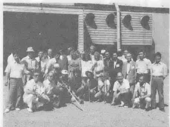
農場のアルバイト学生たちと記念写真

セーレム市民の暖かい歓迎を受けた代表団の訪問は、両市民の将来にわたる固い絆にとって、輝かしい一ページを飾りました。