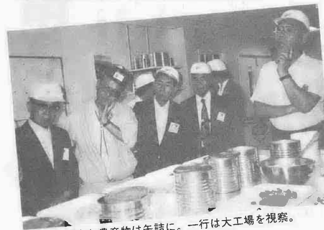
豊富な農産物は各詰に。一行は大工場を視察。