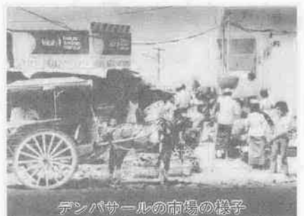
デンパサールの市場の様子

「私のお酒を飲む機会が少ないです。学生でおして宴会をする、最初は皆でガヤガヤと話していますが、だんだんグループにわかれていきますね。いつのまにか