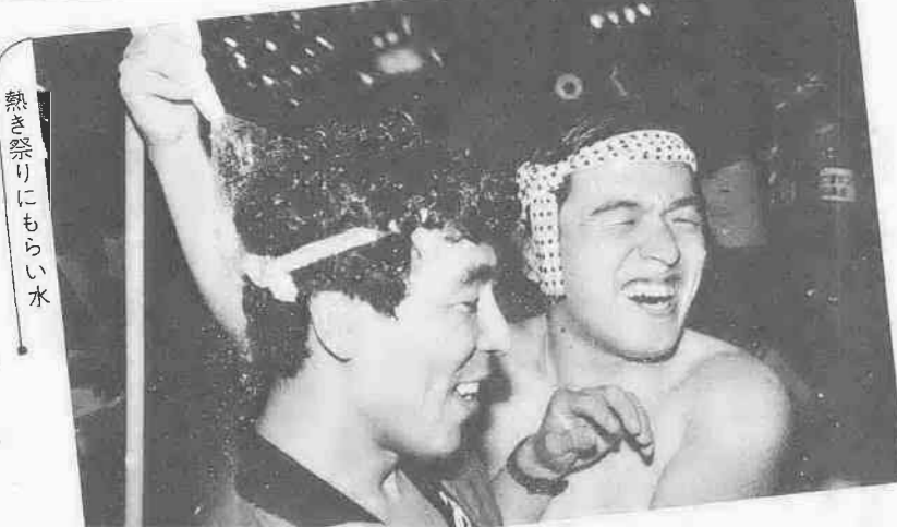
熱き祭りにもらい水