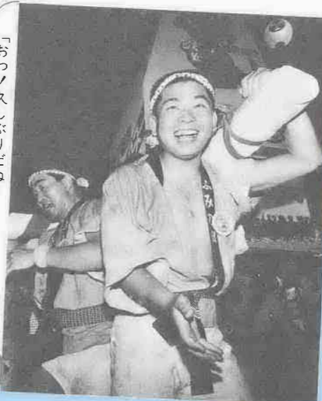
「おっ！久しぶりだね」