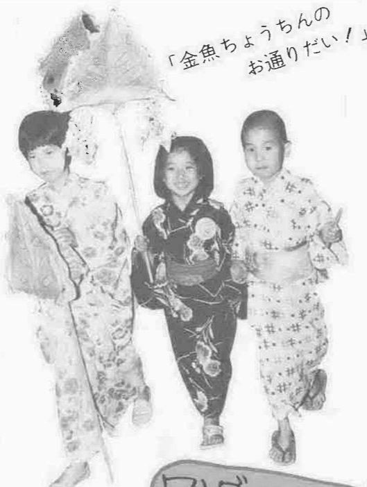
「金魚ちようちゃん お通じだい！」