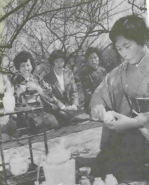
梅の香に誘われ 春の「野点」

働く婦人の園 婦人会館まつり 働く婦人の学習の場として知られる協田新町・婦人会館こ