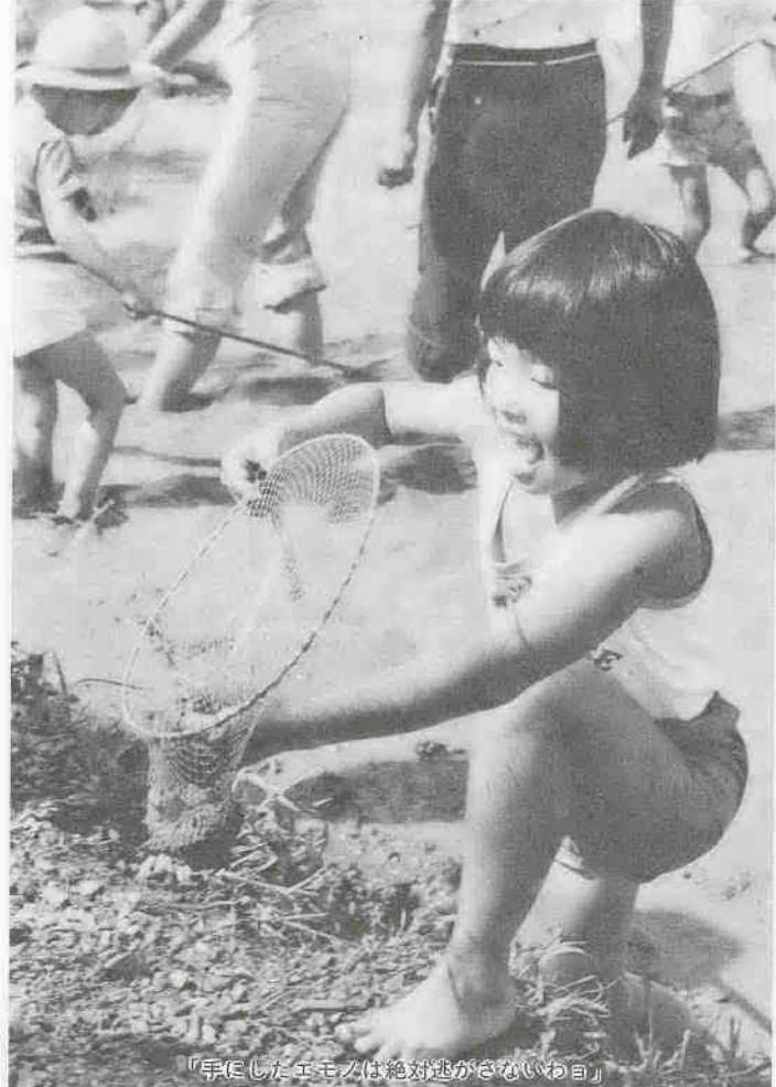
「手にしたエモは絶対逃がさないわよ」

子供のころから水のある風景が好きで、池・沼・湖など、そこで遊んだ記憶は今も鮮かです。川越市内では、石原町と元町の境を流れる新河岸川、高沢橋周辺