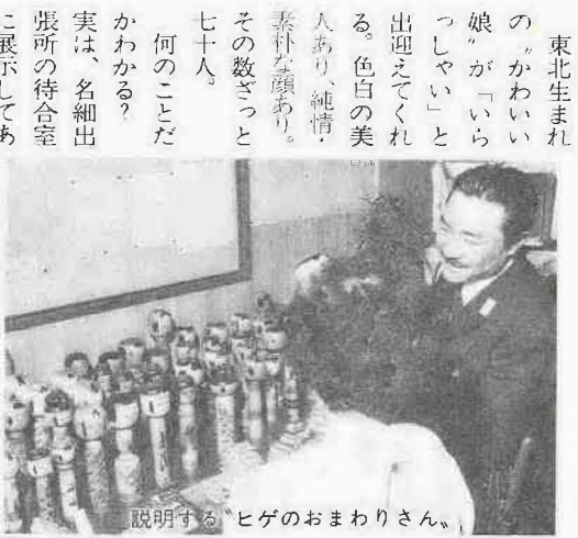
説明するヒゲのおまわりさん。

東北生まれのかわいい娘が「いらっしやい」と出迎えてくれる。色白の美人あり、純情、素朴な顔あり。その数ざっと七十八人。何のこともかわかる？