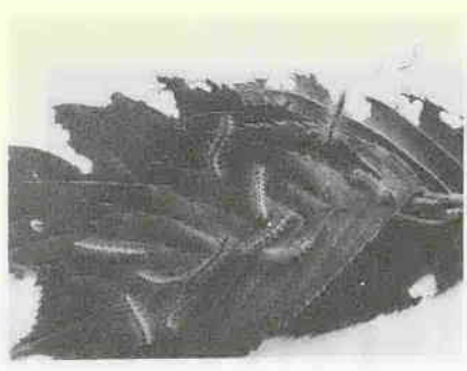
アメリカシロヒトリの第二世代の発生期を迎えました。第二世代は、六月の第一世代に比べ毛虫の量が多く、生育もずっと早いものですから、その被害も大きくなります。被害枝葉の早期発見、早期防除を一層徹底してください。

アメリカシロヒトリの第二世代の発生期を迎えました。第二世代は、六月の第一世代に比べ毛虫の量が多く、生育もずっと早いものですから、その被害も大きくなります。被害枝葉の早期発見、早期防除を一層徹底してください。 ●枝切り・焼殺 アメリカシロヒトリは、サクラ、カキ、ウメ、シラカバなどの落葉樹に発生しやすいので、これらの樹木をよく観察し、被害を受けた枝葉の発見に心がけてください。これらの枝葉は、見つけしだい切り取って寄せ集め、焼くか踏みつぶすかしてください。この方法は、発生期間中何回も繰り返して行うことがたいせつです。 ●薬剤散布 早期防除が遅れ、毛虫が大きくなって樹木に散らばってしまった