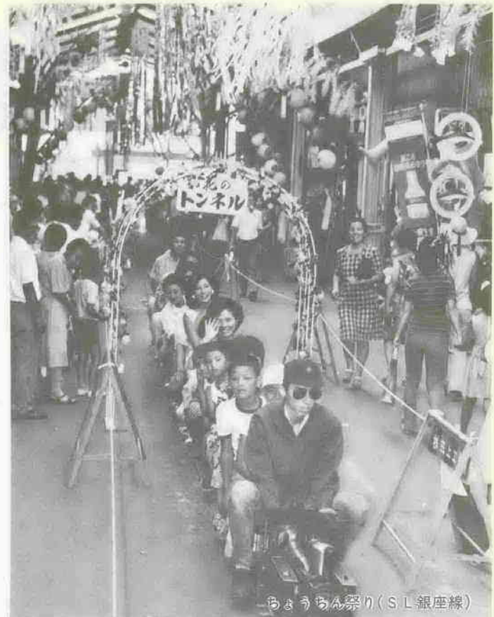
ちようちん祭り(S.L銀座線)