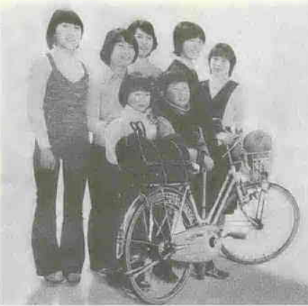
入間郡市同和对策協議会(川越市も加入)では、今回、同協議会加入の全市町の広報紙上で、いっせいに同和問題を正しく理解するための記事を掲載することになりました。

新政府は、日本の近代化をはかるため、いろいろ新しい制度をつくり、改めたりしました。 明治四年、太政官布告によって身分解放令が出され、賤民も解放されました。すなわち、国民はすべて平等となったのです。ところが、武士階級には補償金、農民には土地が与えられ、町人には職業安定策が講じられるなど、いろいろ援助の手がさしのべられました。賤民の人たちには、一片の解放令だけで、経済的な裏づけが全くなされませんでした。賤民だけが、はたかのまま自由社会に放り出されたわけです。そこへさらに納税、兵役、教育などの新しい義務が課されました。貧しさから極貧へ―― これが、今日まで差別を温存させた原因といわれています。 ※この続きは、十二月発行の広報越川に掲載する予定です。 入間郡市同和对策協議会 なお、広報越川では、昭和四十九年から「同和シリーズ」を連載していますが、これまでの掲載紙をご希望の方は企画課広報係へ。