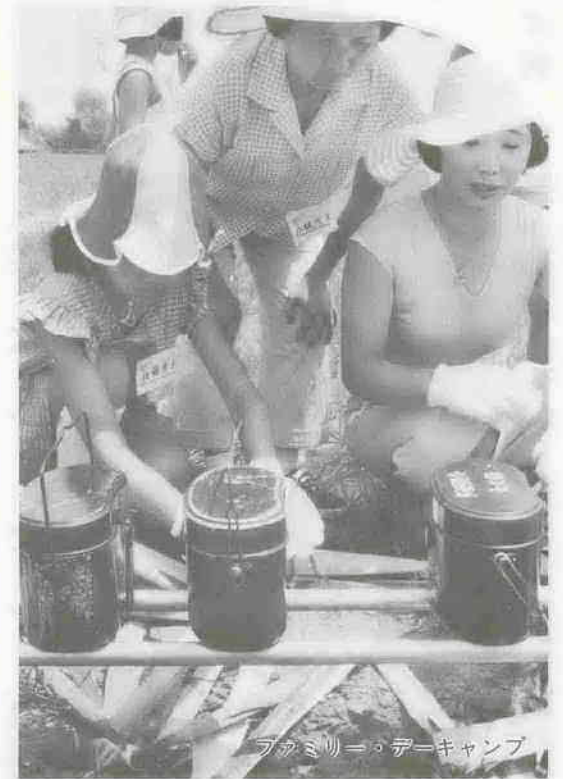
ファミリー・デーキャンプ

まちに暑い日ざしがやって来て、各地で様々な行事が繰り広げられています。 私たちのまちの夏は、なんといっても百万燈ちようちん祭りから。今年も7月21日から25日まで行われ、歩行者広場を中心に約10万人もの人が集い、夏を彩るカラフルなちようちに酔いしれました。→一方、7月24日、伊佐沼で芳野公民館恒例のつり大会が開かれました。今年には18人が参加、早朝からつめかけた太公望には、暑さなんか関係ない。 また、同じ24日伊佐沼公園で、ファミリー・デーキャンプが行われました。川越レクリエーションクラブ主催のこの催し、親子73人が参加。飯盒炊飯に、夏の味覚を見つけたようです。