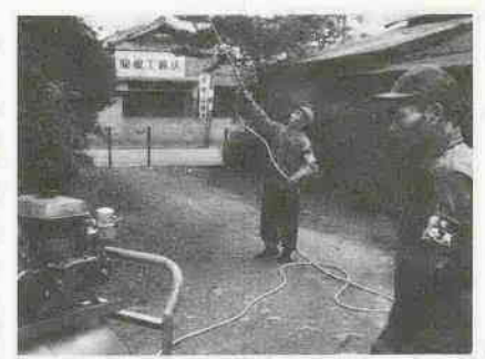
野田町、小ヶ谷、小室の各地区と山田・名細出張所管内 ○八月十七日(水)：東谷出張所管内、南古谷出張所管内のうち萱沼、久下戸地区 ○八月十八日(木)：萱沼と久下戸を除く南古谷出張所管内、大東出張所管内(大田、日東地区) ○八月十九日(金)：芳野出張所管内(御成町、水川町、伊佐沼を含む)、霞ヶ関出張所管内

アメリカシロを完全に退治するためには、どうしても根気と地域協力が必要です。地域ぐるみで取り組んでいこうとすると、効果が上がります。 また市では、自治会等で共同防除を行う場合には、防除機の貸し出しと薬剤の無償交付を行っています。 ※くわしくは、各自治会の衛生委員または農務課農産係(☎24-1881-1、内線四六四)へお尋ねください。