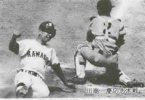
川商一慶応志木戦

7月16日から、初雁球場などで行われた第59回全国高校野球選手権埼玉大会は、7月30日終了。市内から6校が出場、皆さんの熱烈な応援を受けましたが、健闘むなく惜しくも準々決勝までに敗退。来年の活躍を期待したいものです。