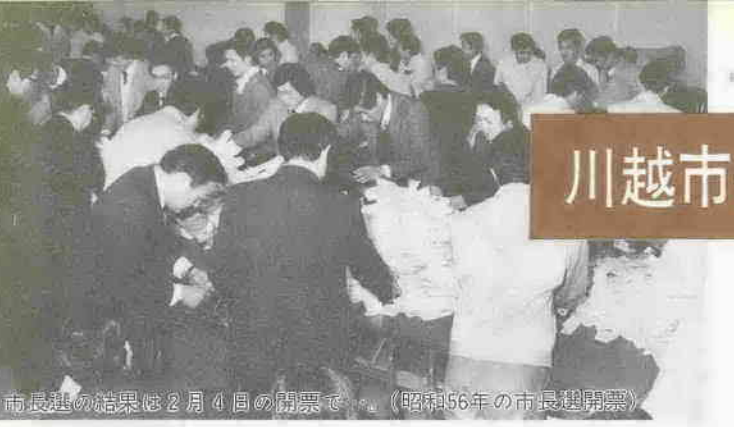
市長選の結果は2月4日の開票で。(昭和56年の市長選開票)

川越市農業委員会委員一般選挙の投票日は、昭和六十年一月二十日(日)に決まりました。 この選挙は、農家の皆さんの代表として、農業生産力の向上、農業経営の合理化など、重要な仕事を する農業委員を選ぶものです。なお、主な日程は次のとおりです。 選挙期日の告示日：昭和六十年一月十三日(日) 立候補届出日：一月十三日(日)