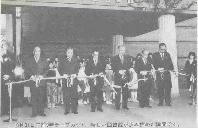
10月31日午前9時テープカット。新しい図書館が歩み始めた瞬間です。

年末資金にお悩みの方 — 市・県の融資制度 年末は何かと資金が必要な時期。市や県では、さまざまな年末資金融資制度を設けています。どうぞご利用ください。 市の融資制度 ▼中小企業近代化資金：貸付限度額Ⅱ二千万円以内、年利Ⅱ七・三%以内 保証料Ⅱ〇・八五% ▼小口金融あつせん：貸付限度額Ⅱ三百万円以内、年利Ⅱ六・八%以内、保証料Ⅱ〇・八% ▼同和対策事業資金：貸付限度額Ⅱ三百万円以内、年利Ⅱ三・〇%以内 ▼無担保無保証人融資：貸付限度額Ⅱ三百万円以内、年利Ⅱ六・八%以内、保証料Ⅱ〇・八% ※申込は、中小企業近代化資金が十二月八日(土)まで、その他は十二月二十日(木)まで商工観光課(☎内線454)で受け付けます。 県の融資制度 業種別組合とその組合員、小規模事業者、信用組合である中小企業者が融資対象です。 ▼貸付限度額：五百万円。ただし業種別組合とその組合員は一千万円(知事が特に認めた場合は三千万円)。