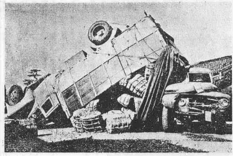
(写真は交通事故現場—警察のあゆみ誌より)

昨年中埼玉県で起こった交通事故 件数は、四〇九件もあります。 このうち死者二九四人、負傷者五 六八八人、物の損害一億七千余万 円という額にのぼり、前年に比べ ると、件数で三六%、死者八%、 負傷者三%、物の損害八〇%と それぞれ大巾に増加し、川越市で は三四九件死者一九人、負傷者三 三八人、物の損害額七二六万円と なっています。全国では死者二 四万人でこれは熊谷、川口市あ りの人口全部が交通事故にあつて 生じたに等しいといえることにも なり、いかに多くの事故が毎年起 こっているかがわかります。 〇交通安全を推進するためには、 交通安全法を守り、交通安全意識 を高めていくことが大切です。 〇交通安全法を守り、交通安全意識 を高めていくことが大切です。