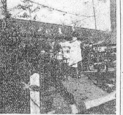
(寫眞説明) 一月十七日第三學校改築の起工式が行われました。目下大車輪で改築工事施行中です。

講和記念桐樹育成委員会規程設けらる 市役所商工課内に講和記念桐樹育成委員会が設けられました。この委員会は講和記念桐樹栽培奨励條例に基づいて桐苗の選定、植付者の指定及び植付後の育成指導に關し市長の