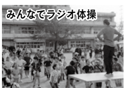
みんなでラジオ体操

新宿町一丁目から新宿町六丁目までの区域で活動しています。地域内のさまざまな課題について部会ごとに話し合い、情報交換会において対応策を検討するなど、課題解決に向け一歩一歩進めています。取り組みとしては、地域で実施する「新宿フェスタ」と連携して、ラジオ体操を通じた健康増進事業、避難訓練事業を毎年実施しています。