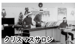
クリスマスサロン

川鶴地域まちづくり基本計画を策定し、「この地に住むあらゆる人たちが、豊かな自然を大切にしながら常に共助の精神で助け合い、健康で安心して住めるコミュニティあふれる川鶴の街を創造する」を目標に、地域交流サロンを定期開催するなど、毎年、さまざまな活動を実施しています。今年度は、地域安全マップを作成し、今後の地域活動に活用していきます。