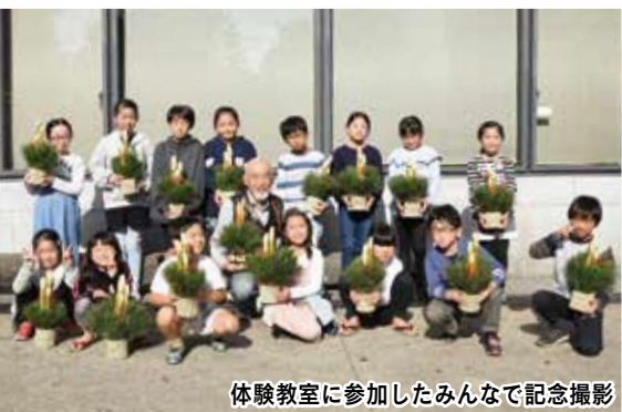
体験教室に参加したみんなでの記念撮影

子どもたちは持ち帰った手作りのミニ門松を飾ってお正月を迎えたのではないのでしょうか。