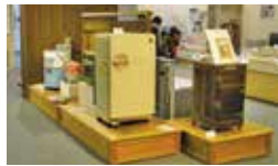
洗濯機以外の家電の移り変わりもご覧になれます

昭和30年代から40年代は、洗濯機だけでなくテレビや冷蔵庫など、人々の暮らしが大きく変わった時期です。博物館では、「むかしの勉強・むかしの遊び」展を開催し、この年代を中心とした教室・居間・台所や駄菓子屋の店先を再現します。