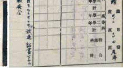
日誌の表紙(左下)と8月15日の記述

市立博物館で開催中の収蔵品展「戦中・戦後の川越の歩み」では、この日誌をはじめ、主に昭和10〜20年代の資料約140点を紹介し、この時期の川越の歩みを振り返ります。多くの皆さんから頂いた資料を通して、出征した兵士や兵士を送り出した人々がどんな境遇にあったのか、どのような時代だったのかを学び、平和な時代に生きる尊さを考える機会となれば幸いです。