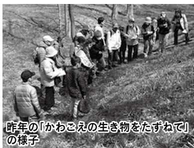
昨年の「かわごえの生き物をたずねて」の様子

私たちがずっと安心して暮らすためには、自然の中のさまざまな生き物を守っていくことが大切です。未来へ暮らしやすい環境をつないでいけるように、生物多様性の大切さを考えてみませんか。