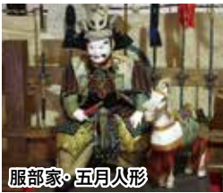
服部家・五月人形

ひな祭り(上巳の節句)やこどもの日(端午の節句)に飾られる節句人形も同様の特徴があります。川越では例年、一番街の蘭山記念美術館や服部民俗資料館で江戸のひな人形や五月人形が公開されています。慶応元年製の服部家の五月人形は、のぼり旗などとともに三代仲秀英の作で、江戸文化漂う当時の川越商家の節句行事を今に伝えてい