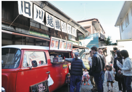
旧川越織物市場はイベント等で不定期に開放されています

市内にある数多くの神社仏閣。それらは信仰の対象としてはもちろん、祭りや花見などの年中行事、遊びや憩いの場として、人々の生活に潤いを与え、門前のたたずまいや周囲の景観とともに地域文化を育んできました。その一つである蓮馨寺。その正門から続く通りが立門前です。この一帯はかつて蓮馨寺の境内で、「旧鶴川座」(明治31年建築)などの芝居小屋や見せ物小屋が建ち、緑日を中心に芝居公演やサーカスなどが開かれ、門前界隈としてにぎわいました。通りの北側にある「旧川越織物市場」(明治43年建築)は、川越が織物の集散地として栄えたことを今に伝えます。また、昭和8年に蓮馨寺境内を抜けて開通した中央通りと同様、昭和初期に建てられた看板建築が残り、昭和の面影を感じさせます。今は落ち着いた通りとなつている立門前。またにぎわいが戻ること、昔から通りを見守る建物も望んでいるように見えます。