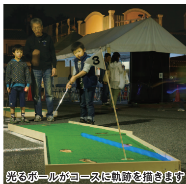
光るボールがコースに軌跡を描きます

定休日…水曜日 年末年始の休業日…12月31日(水)~1月4日(日) 営業時間…午前9時30分~午後6時(30日(火)は午後3時まで) 問い合わせ…☎227-0831