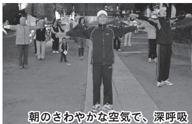
朝のさわやかな空気で、深呼吸

夏休みの後もラジオ体操をしたいという声と「いきいき川越大作戦」をきっかけに、平成25年7月から野田神社(野田町1丁目)でラジオ体操が行われるようになりました。中心となっているのは、野田町1丁目自治会の