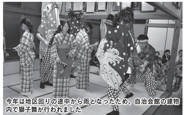
今年は地区回りの途中から雨となったため、自治会館の建物内で獅子舞が行われました

7月19日・20日に行われた市指定無形民俗文化財「福田の獅子舞」。曲を奏でる笛には、縦笛が使われています。これは、横笛を吹ける人が少なくなった際、学校で習う縦笛ならば子どもたちに伝承できることから考案され、地元の小学生が練習をしています。獅子やハイオイ、ササラッコは中学生くらいになると演じ始め、伝統が継承されていきます。