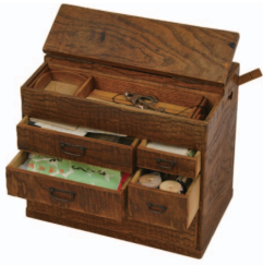
小さな抽斗をたくさん備えた針箱

右の写真は、江戸時代に登場した箱階段です。これは見た目通り階段として利用しましたが、階段下には抽斗や戸を設け、収納としても使いました。階段としての強度を持たせたいえ、収納のための抽斗などをびたりと造り込むには高い技術が必要です。また、江戸時代には2階を持つことが規制されていたため、箱階段を移動させたり、階段状の家具だと言ったりすることで、2階の存在を隠すためにも使われました。現代でも、階段下を収納やトイレなどに利用する住宅や、箱階段と似たデザインの家具を見かけることがあります。生活習慣の変化とともに暮らしの中の収納は移り変わりますが、その時代に合わせた「より良く収納したい」という思いに変わりはありません。9