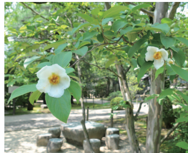
中院でかれんに咲くナツツバキ。シヤラノキとも呼ばれています

日差しが日に日に力強さを増してきました。太陽の光をあびて青々と葉を茂らせる木々に夏の訪れを感じます。夏らしい写真を撮ろうと市内を散策していると、元氣よく咲くアジサイ、楚々と花開いたナツツバキ、りんとしたたずまいのユリなどに出会いました。暑さに負けず、生命力いっぱい伸びる植物たちから元気を分けてもらった心地です。これから夏本番。花火大会やプールなど、楽しいスケジュールを組んでいる人も多いのではないのでしょうか。日頃から体力をつけて夏バテを防ぎ、思い出っぴいの夏にしましょう。