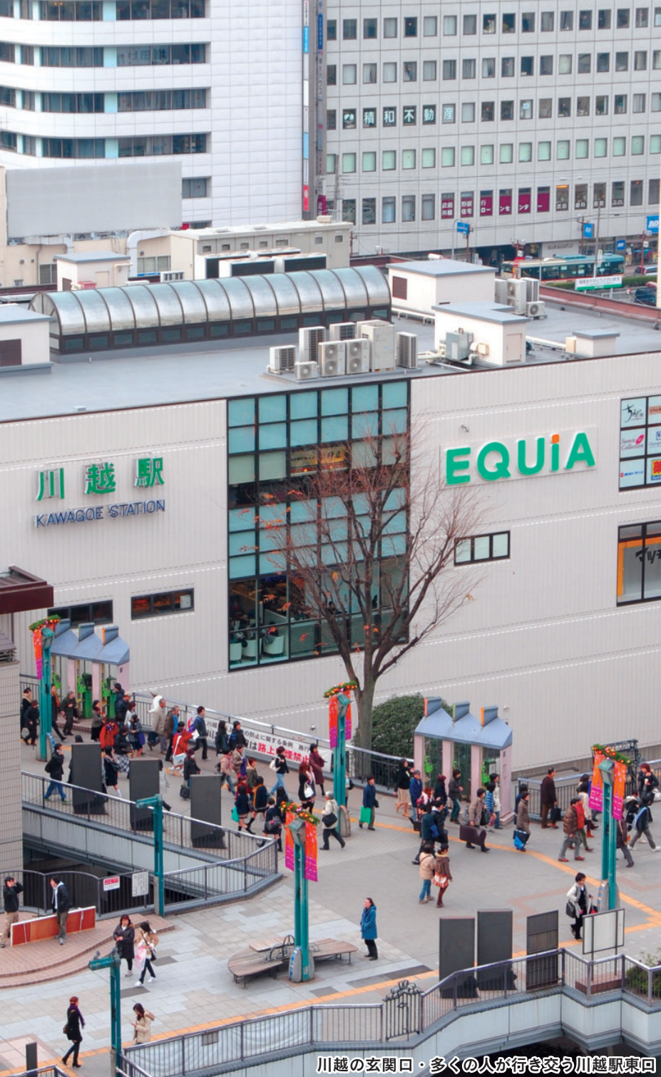
川越の玄関口・多くの人が行き交う川越駅東口