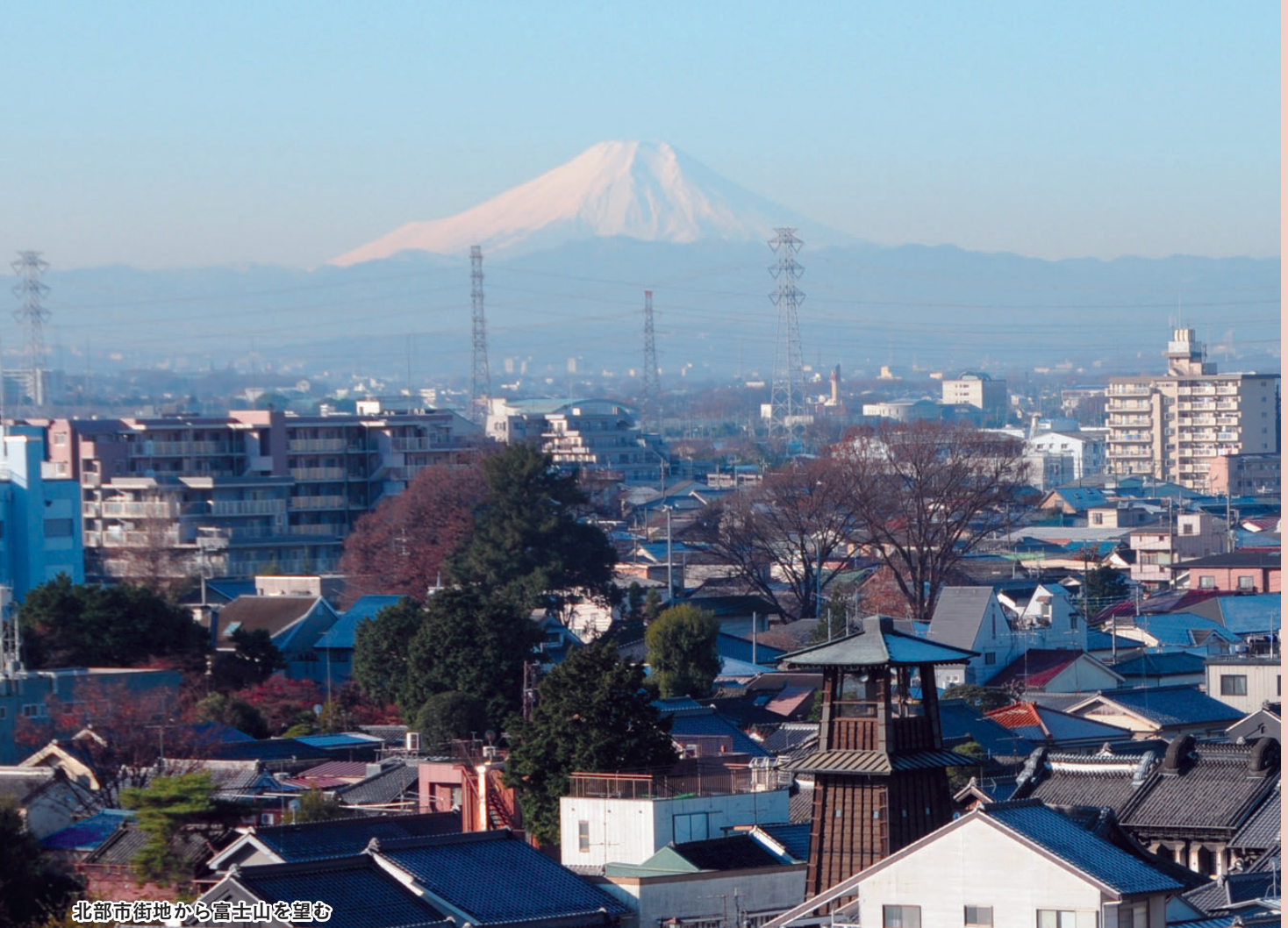
北部市街地から富士山を望む

の皆さんを、温かくもてなすことができるよう努めてまいります。そして、さらに多くの観光客の皆さんにお越しいただくため、観光環境の整備を進めております。正に今、川越は全国から注目を浴び、上昇気流に乗っております。観光客一千万人に向けて、大きな力になると期待しております。