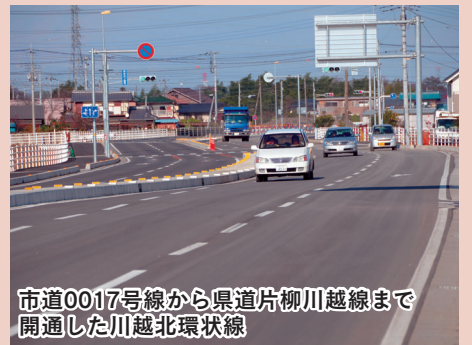
市道0017号線から県道片柳川越線まで開通した川越北環状線

点として、多くの市民の皆様にご利用いただいております。 ことし十二月に完成予定の（仮称）名細地区統合公民館は、出張所・公民館の機能を持ち、地域の生涯学習の拠点・地域コミュニケーションを推進する施設として建設を進めてまいります。 川越城本丸御殿は、雨漏りなど建物の老朽化が進行していることから、平成二十三年春の完成を目指し昨年十月に保存修理工事に着手いたしました。また、児童生徒の安全を確保し、災害時の避難所としての安全を向上するため、小中学校校舎の耐震化を推進してまいります。