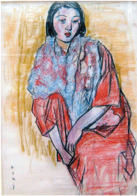
岩崎勝平 赤衣着物の女 77cm×54.5cm パステル

この特別展は、三月二十二日(日)まで行われます。詳しくは、十二月二十五日発行の広報川越・七ページをご覧ください。