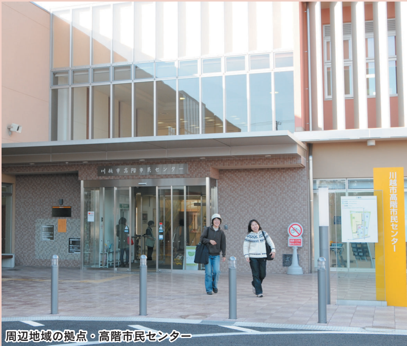
周辺地域の拠点・高階市民センター

周辺の拠点・高階市民センターには、東部地域ふれあいセンターが、多目的ホールや会議室を備えた施設としてオープンいたしました。市民の皆様との相互交流を促進するとともに、文化向上と心豊かな地域社会づくりを推進しております。