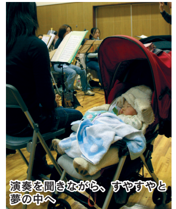
演奏を聞きながら、すやすやと夢の中へ