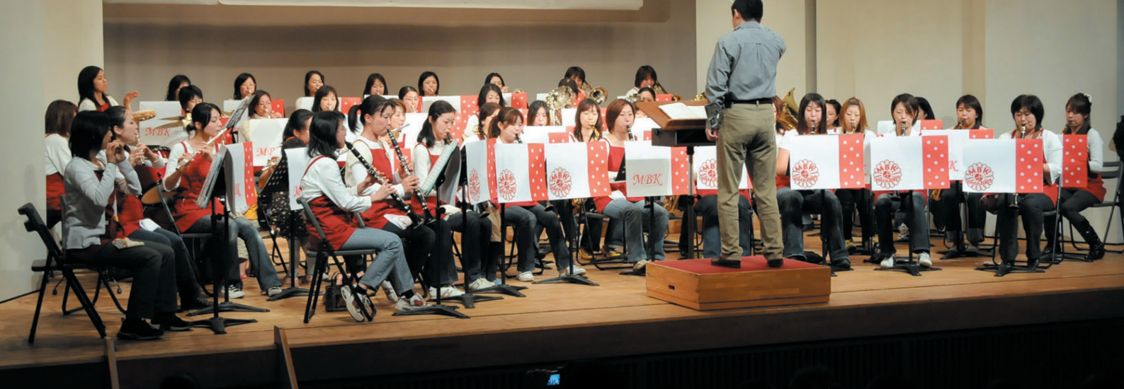
演奏会では赤いエプロンを着けて、舞台上がります。写真は、11月に行われた第2回子育てフェスタ川越の様子