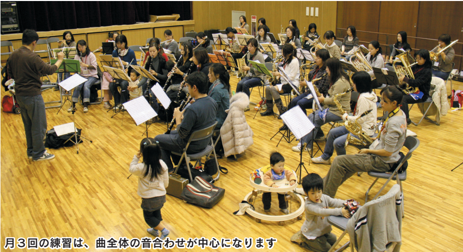
月3回の練習は、曲全体の音合わせが中心になります

子育て中のお母さんが中心となって活動している、ママさんブラス川越。平成19年5月に結成され、ことし活動開始から2年を迎えます。メンバーの皆さんは、家事や子どもの世話など、忙しい時間の合間を縫って、練習をしています。この記事では、ママさんブラス川越の活動の様子を紹介します。