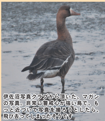
伊佐沼写真クラブから頂いた、マガンの写真。非常に警戒心が強い鳥で、もっと近づいて写真を撮ろうとしたら、飛び去ってしまったそうです

マガンにかかわらず、動物は気温や水温といった自然的条件が整い、安心でき、餌が取れる環境があれば、生息しやすい快適な場所として認識するようです。川越が再びマガンにとって快適な場所になってきているのでしょうか? 今後、多くの生き物にとって良好な生息の場となる環境を保全し、生態系の維持や種の保存につなげていきます。