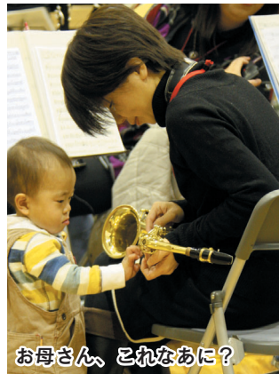
お母さん、これなあに？