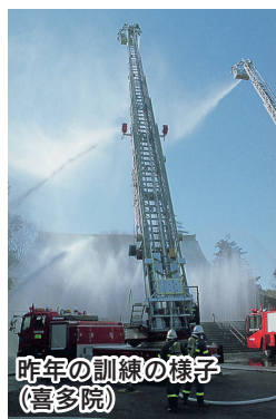
昨年の訓練の様子 (喜多院)

期日前投票の日時・会場：1月19日(月)～24日(土)、午前8時30分～午後8時 本庁舎七階 7A会議室 ▼ 1月21日(水)～24日(土)、午前10時30分～午後7時 IIアトレ六階 コミュニティルームA・メルト (西文化会館) ・高階市民センター