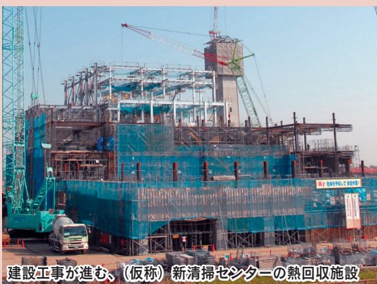
建設工事が進む、(仮称)新清掃センターの熱回収施設

また、市役所前を通る都市計画道路三田城下橋線につきましては、中心市街地の交通の円滑化と市民の皆様の安全