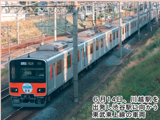
6月14日、川越駅を出発し渋谷駅に向かう東武東上線の車両

写真は掲載することができません。 写真をご覧になりたい場合は、市役所 など配布している、広報川越を ご覧ください。