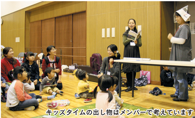
キッズタイムの出し物はメンバーで考えています