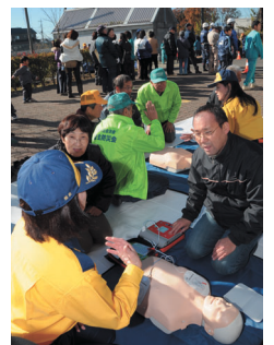
大東地区消防特別点検・防災訓練のAED講習