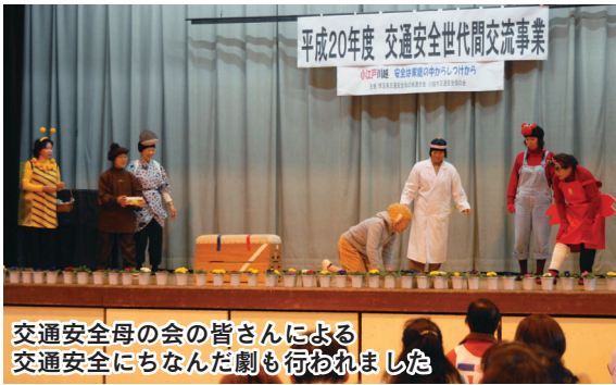
交通安全母の会の皆さんによる交通安全にちなんだ劇も行われました