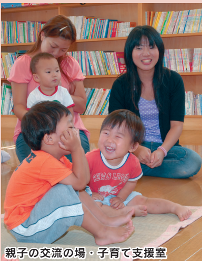
親子の交流の場・子育て支援室

少子高齢化の進展、家庭や地域における相互のつながりの希薄化など、私たちの生活を取り巻く環境は大きく変化しています。市民