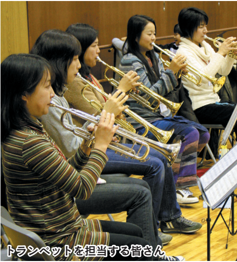
トランペットを担当する皆さん

子育て中のお母さんが中心となって活動している、ママさんブラス川越。平成19年5月に結成され、ことし活動開始から2年を迎えます。メンバーの皆さんは、家事や子どもの世話など、忙しい時間の合間を縫って、練習をしています。この記事では、ママさんブラス川越の活動の様子を紹介します。