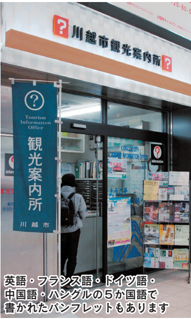
英語・フランス語・ドイツ語・中国語・ハングルの5か国語で書かれたパンフレットもあります

三月三十日(月)から、小江戸川越を舞台にしたNHK連続テレビ小説「つばさ」の放送が始まります。さらに多くの観光客の皆さんで、川越のまちも同案内所にもぎわいそうです。