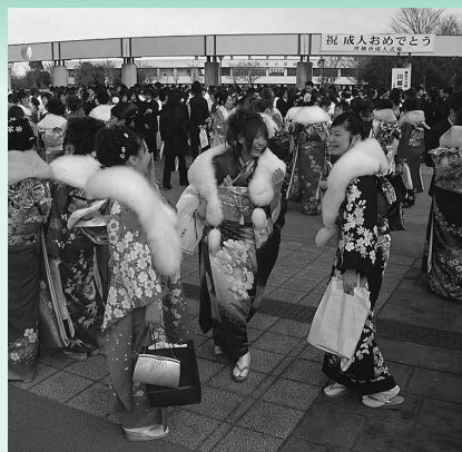
ことしの成人式の様子