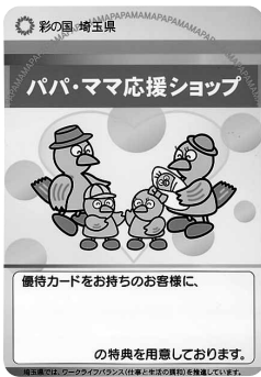
このステッカーが目印です