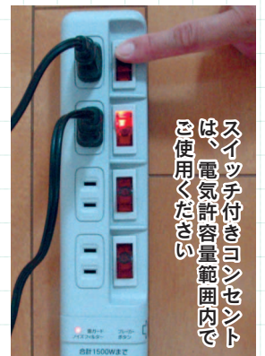
スイッチ付きコンセントは、電気許容量範囲内で使用ください