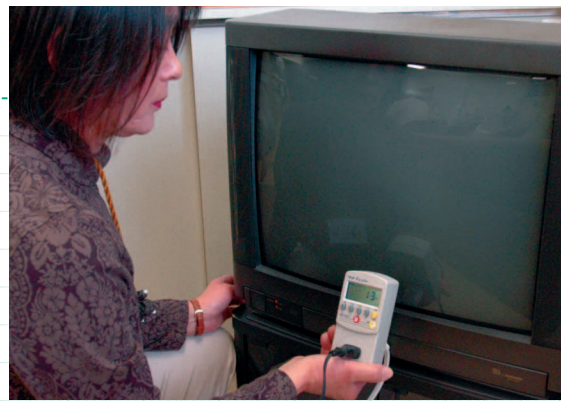
テレビの待機時消費電力を計ったところ、13ワットでした

秋真っ盛りの10月は、市内各地で多彩なイベントが開催されました。主なものでは、10日の川越ナンバー誕生記念式典、13日の川越市・米国オレゴン州セーレム市姉妹都市提携20周年記念式典、14日・15日の川越まつり、21日・22日の川越産業博覧会が行われ、広報担当にとって大忙しの月になりました▶取材を通して感じたのは、各イベントの人出が多かったこと。特に川越まつりは2日間で初めて100万人を突破しました。テレビや雑誌などで川越が紹介されたのも一因かと思いますが、市民の皆さんの積極的な取り組みがあってこそだと思います▶10月10日から川越ナンバーの車が走り始めました。私も近々川越ナンバーに変える予定です。川越の宣伝を兼ねながら紅葉シーズンのドライブを楽しみたいと考えています。