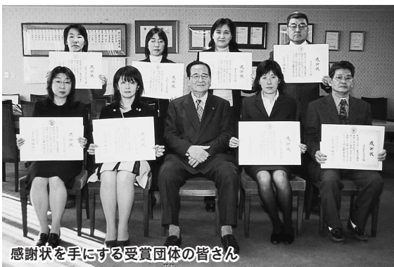
感謝状を手にする受賞団体の皆さん

受賞した団体に舟橋市長から感謝状と記念品が贈られました。集団回収を継続して実施していくことで、ごみの減量化・資源化が図られるだけでなく、地域コミュニティの活性化にもつながります。今後も市民の皆さんのご協力をお願いし