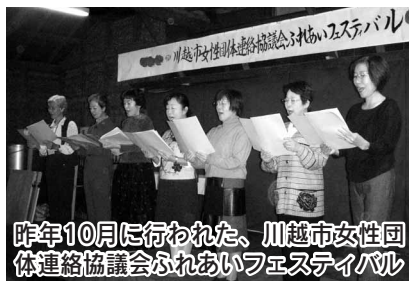
昨年10月に行われた、川越市女性団体連絡協議会ふれあいフェスティバル

問い合わせ…川越市女性団体連絡協議会事務局（男女共同参画課内） TEL内線2441