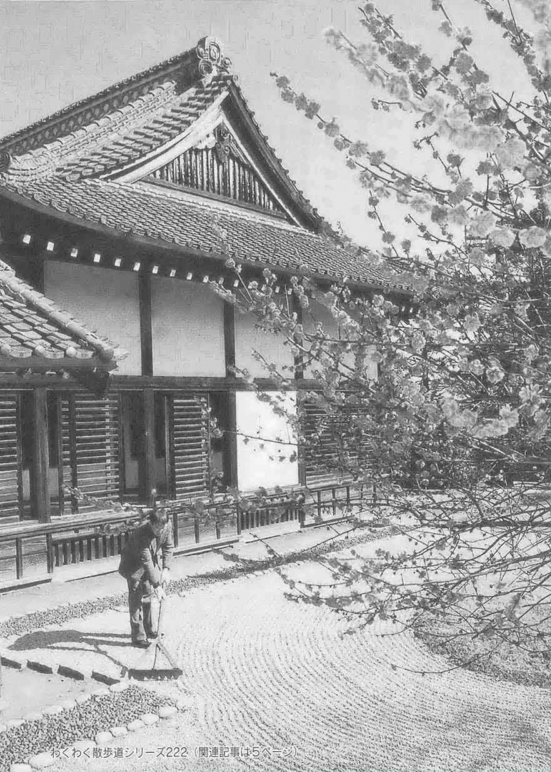
わくわく散歩道シリーズ222 (関連記事は5ページ)