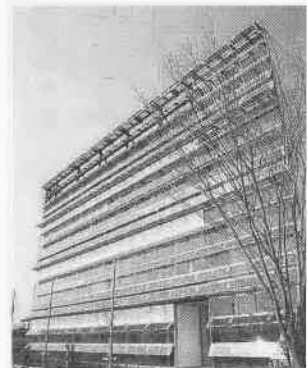
新しい川越市保健所が小ヶ谷に完成

健康づくりを推進するため、保健活動の拠点として、川越市総合保健センターを開設しました。これにより、各種健康診査の充実を図るとともに、健康づくりの拡大や施設の改修、指導員の待遇改善に、引き続き努めていきます。乳幼児医療については、対象年齢を拡大してまいりましたが、四月からは社会保険等加入者の、窓口での乳幼児医療費の無料化を実施します。