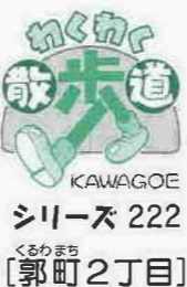
シリーズ 222 〔郭町2丁目〕

問い合わせ：①保健総務課総務企画係 TEL227-5100 ②生活福祉課総務係 TEL22522