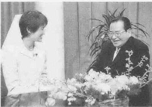
収録の様子（川越ケーブルテレビ）

平成十六年度予算を語る 家光公生誕四百年記念事業をはじめ、平成十六年度予算の概要について、舟橋市長が語ります。まちの話では、小江戸川越春まつりの開会式と合わせ、小江戸川越大使の委嘱式の様子をお伝えします。