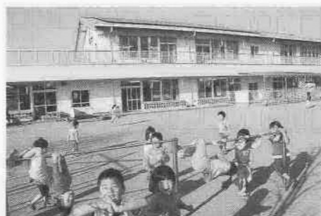
平成14年4月に移転新築した大東保育園。4月からは名細保育園が定員を増やして移転新築。子どもたちの笑顔も増えます

健康づくりを推進するため、保健活動の拠点として、川越市総合保健センターを開設しました。これにより、各種健康診査の充実を図るとともに、健康づくりの拡大や施設の改修、指導員の待遇改善に、引き続き努めていきます。乳幼児医療については、対象年齢を拡大してまいりましたが、四月からは社会保険等加入者の、窓口での乳幼児医療費の無料化を実施します。