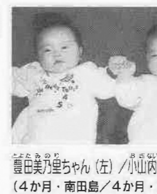
七月生まれの同期の彼