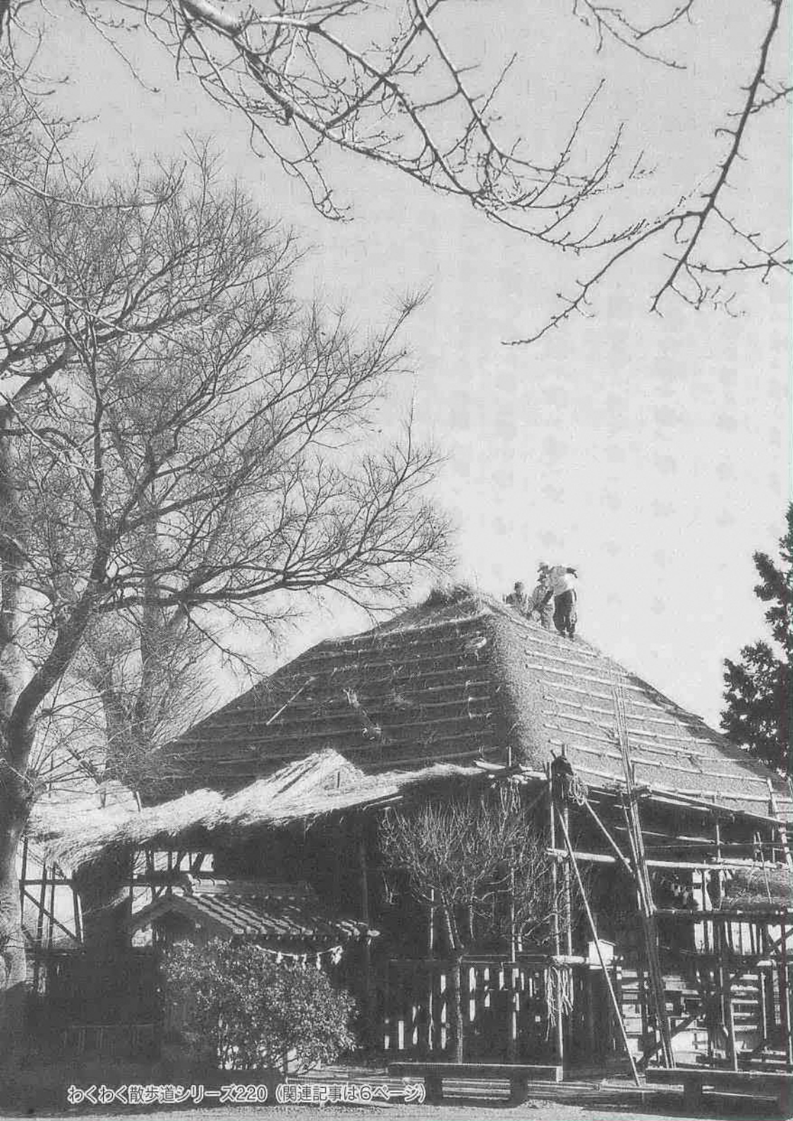
わくわく散歩道シリーズ220 (関連記事は6ページ)

市・県民税の申告、所得税の還付申告・確定申告：4・5 チャイルドシート購入に補助しています：8 川越市交通災害共済の加入予約受け付け開始：9 お知らせパック：10 ひとまち伝言板：17 けんこう：22