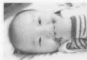
みんなボクにメロメロさっ♡