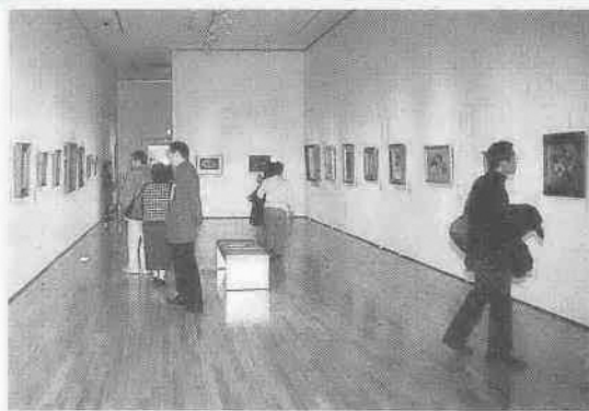
市立美術館で開催中の「楳嶺名作展」

環境政策課が行っている「星空観察のつどい」を通して、星空と大気の関係について考えます。また、第五十五回川越市成人式の様子と合わせ、市立美術館で開催中の「楳嶺名作展」をお知らせします。