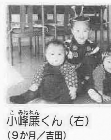
川越まつり三人組