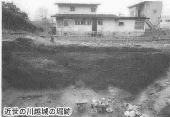
近世の川越城の堀跡