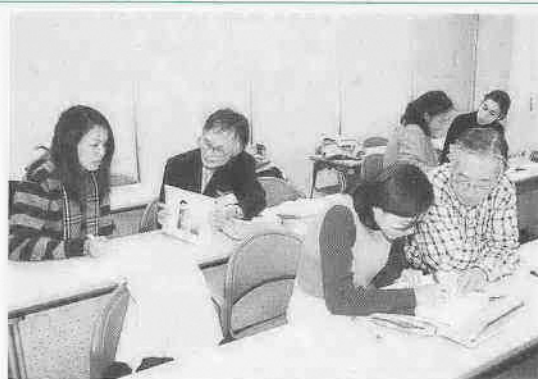
国際交流センターで行われている「クラスで日本語」の様子

国際化の拠点施設である国際交流センター。同センターで行われている講座を紹介します。まちの話題では、江戸開府四百年を記念し開催された江戸天下祭に参加した志多町・弁慶の山車の姿をお伝えします。