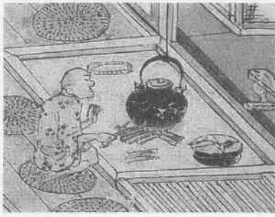
室町時代の絵巻物「慕婦絵詞」に描かれたなべやかま（浄土真宗本願寺派蔵・©中央公論新社）

つまり、なべやかまを修理・回収・再生するリサイクルのシステムが完ぺきに機能していたために、ごみとして捨てられることがなかったと考えられます。だからこそ、いくら発掘をしても見つけないのです。