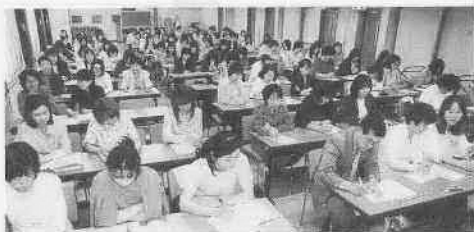
昨年度、開催された小中学校のPTA運営講座。参加者はほとんどが女性でした。