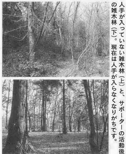
人手が入っていない雑木林(上)と、サポーターの活動後の雑木林(下)。現在は人手が入らなくなりがちです。

さん(60歳・笠幡)は、「こうした作業は好きだし、おもしろいけど、それだけじゃ無責任だと感じます。きちんと見届けたい。それこそ三十年後までサポーターをするぐらいの気持ちでいたいです」と、つこり。