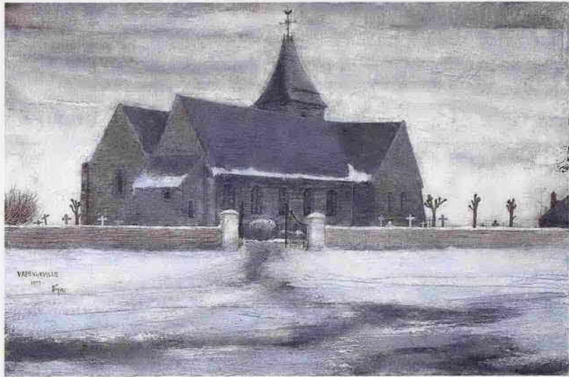
雪の教会 バレンジビル 30M 1979