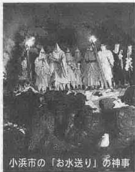
小浜市の「お水送り」の神事

小浜市では、毎年三月二日に東大寺二月堂（奈良市）へ「お水送り」神事が行われます。市内にある神宮寺本堂の回廊では、赤装束の僧りよが大松明を左右に振りかざす達陀の行が行われ、大護摩がたかれます。大護摩からもらい受けた火は、山伏姿の行者や白装束の僧りよら先頭にしたり三千人ほどの松明行列となり、ほら貝の音とともに約二キロ離れた遠敷川上流の鵜の瀬に向かいます。鵜の瀬でも護摩がたかれ、白装束の住職が祝詞を読み上げ、竹筒からお香水を遠敷川へ注ぎます。このお香水が、十日間かかって東大寺に届くといわれています。