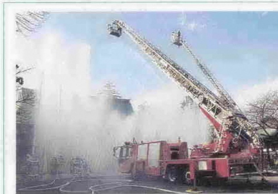
文化財防火デー消火訓練（1月22日・喜多院）

小江戸の冬 火の用心! 昨年末からことしにかけて市内では放火の疑いのある火災が発生しています。ちょっとした気遣いで、しっかり火の用心。まちの話題では、福原地区元巨マラソン・成人式・湯立て祭りなどの様子を紹介します。