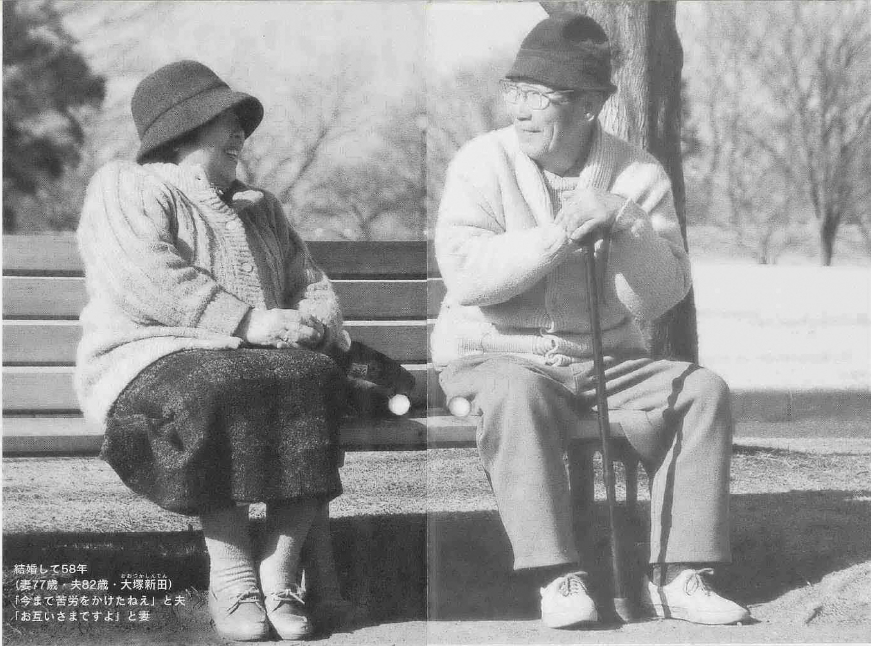
結婚して58年 (妻77歳・夫82歳・大塚新田) 「今まで苦勞をかけたねえ」と夫 「お互いさまですよ」と妻