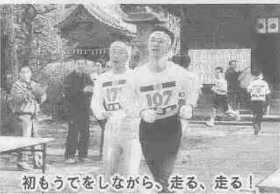
初もうでをしながら、走る、走る!

ことしで26回目を迎えた福原地区元旦マラソン。7歳から72歳までの132人が参加し、全員が完走しました。「小学生のころから参加しています。疲れたけどおもしろかった」「これを走らないと新年が始まらないって感じ」と話すのは、友人同士で参加した中学2年生。沿道のあちこちで声援が送られるなど、地域で親しまれている様子が印象的でした。