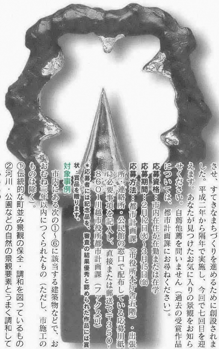
都市景観表彰記念トロフィー 「大地の輪」

都市計画課都市景観係 ☎224-8811 内線3215・FAX 225-9800