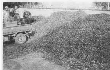
落ち葉を集め、たい肥作りの場所へ運びます。集まった落ち葉の量は圧巻です。