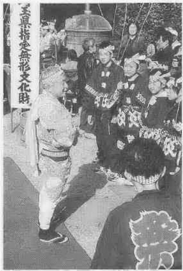
1月14日に行われた南大塚のもちつき踊り。地域の文化を伝えるため、男性も積極的に参加しています。

他の意見として、女性からは「女性も個人として生きる力をつける必要があるのではないか。生涯のパートナーとして、いっしょに生きていければよいと思う」「人それぞれでいいのではないか」、男性からは「男女ともに能力の発揮できる場で活躍できればいいと思う」「私は主夫になりたい」などの意見がありました。また「女性も社会に出て能力を発揮する」ためには、