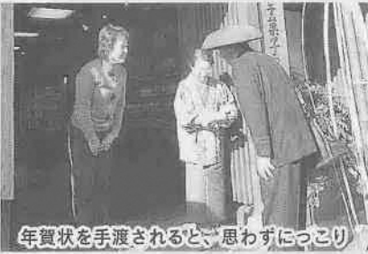
年賀状を手渡されると、思わずにつこり

元旦の一番街に現れた見慣れない服装の人たち。これは「明治時代の郵便配達員の服装で年賀状を届けよう」というイベントで、川越郵便局が市制施行80周年を祝って実施したものです。囃子や獅子舞がはなを添える中、3人の配達員が時の鐘から仲町交差点までの家々を訪れました。レトロな雰囲気の服装は、蔵のまちにもよく似合っていました。