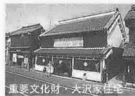
重要文化財 大沢家住宅