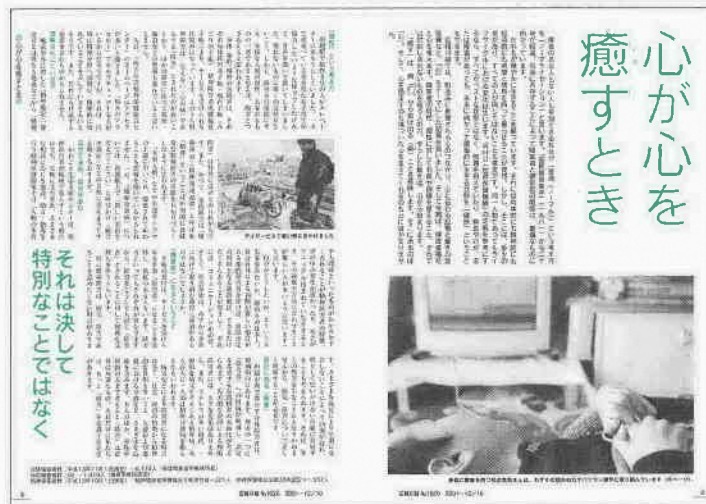
広報川越No.1020 2・3ページ