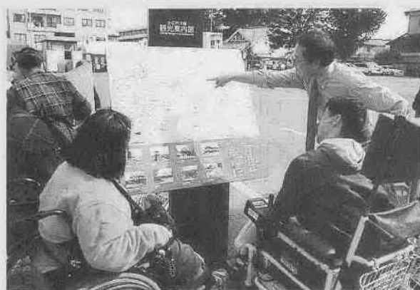
市役所本庁舎前駐車場の北西角に設置した観光案内図