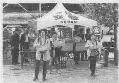
クリアモールに設置された「一日交番」