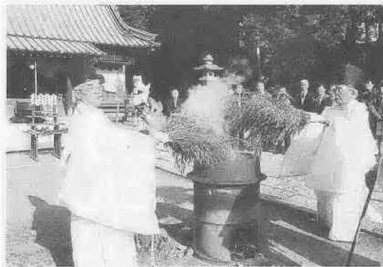
1月14日に行われた湯立て祭り(古尾谷八幡神社)

昨年末からことしにかけて市内では放火の疑いのある火災が発生しています。ちょっとした気遣いで、しっかり火の用心。まちの話題では、福原地区元旦マラソン、成人式、湯立て祭りなどの様子を紹介します。