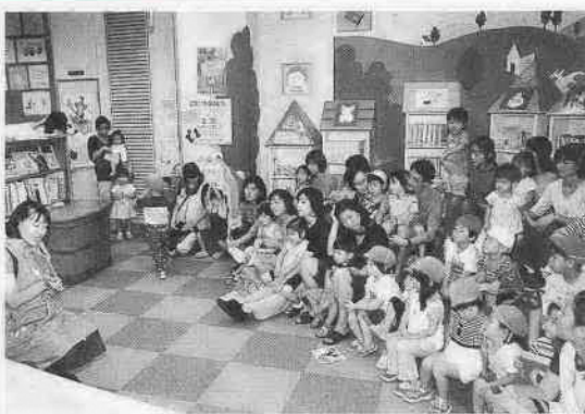
市立図書館で行われた「ひよこおはなし会」(9月12日)

図書館は、私たちが身近に活用できる施設。本を借りることはもちろん、ほかにもいろいろな楽しみ方がある市立図書館の魅力を再発見します。読書の秋、図書館でのひとときを過ごしてみませんか。