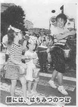
腰には、はちみつつぼ