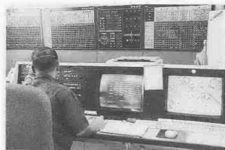
川越消防署3階にある指令室