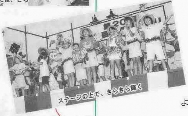
ステージの上で、きらきら輝く