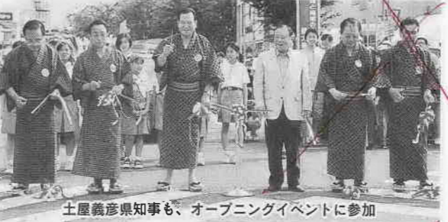
土屋義彦県知事も、オープニングイベントに参加