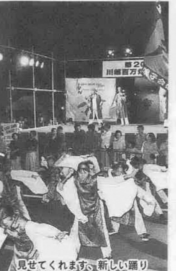
見せてくれます、新しい踊り