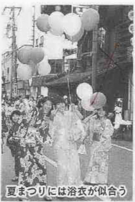
夏まつりには浴衣が似合う