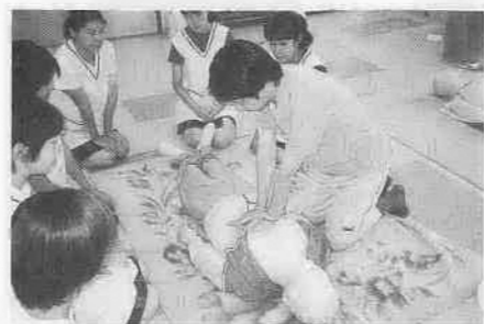
普通救命講習の様子