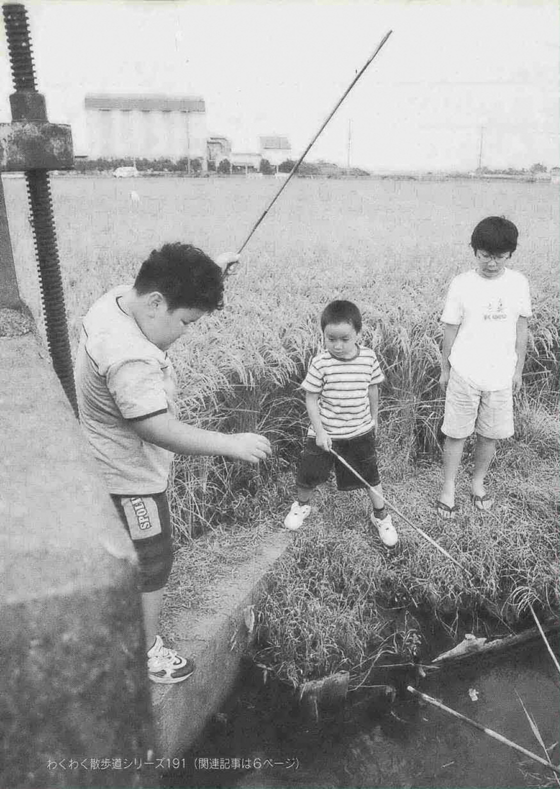
わくわく散歩道シリーズ191 (関連記事は6ページ)