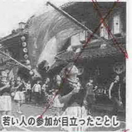
若い人の参加が目立ったことし