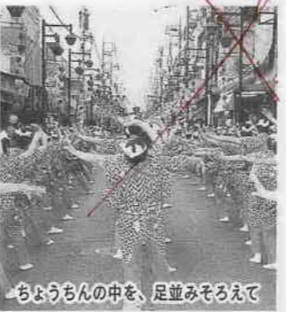
ちようちんの中を、足並みそろえて