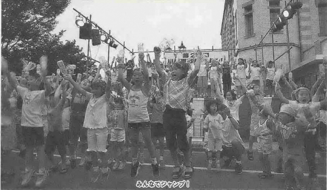
みんなでジャンプ!