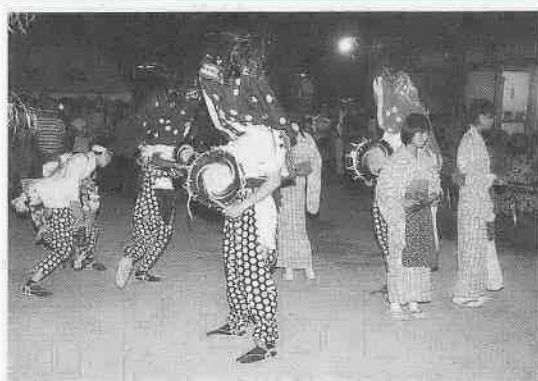
8月5日、赤城神社（福田）で行われた「福田の獅子舞」も紹介

小江戸川越秋の七草めぐり 毎月一日は、小江戸川越七福神めぐりの日。七福神を祭る市内の寺は、秋の七草でも有名です。今回の「わが街川越」では、七福神と秋の七草を巡る旅を紹介します。秋のひとつき、散歩でもいかがですか。