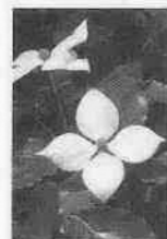
も同時に配布 鉢と培養土 も同時に配布 も同時に配布

昨年度に引き続き、「緑のパートナー」を募集します。これは、パートナーの皆さんに市から配布された樹木の苗木を一定期間育てていただき、成長したら市内の公共施設等へ移植、さらに大きく育てるといったものです。移植後も各樹木にパートナーの氏名等を掲示しますので、愛着を持って成長を見守ることが出来ます。