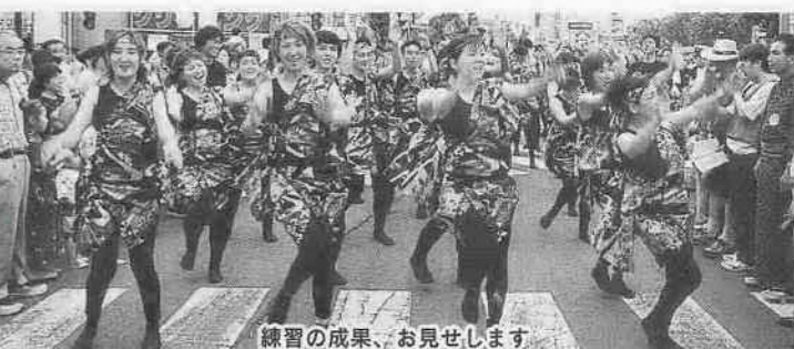
練習の成果、お見せします