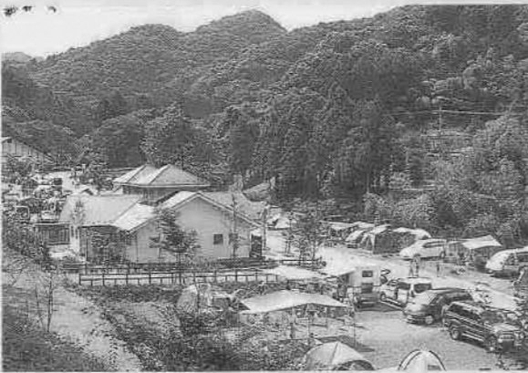
ゆずの里オートキャンプ場 (毛呂山町)

ゆずの里オートキャンプ場は、毛呂山町にある公営のキャンプ場です。車で毛呂川を臨むキャンプ地まで直行。移動に時間をかけずにキャンプ地まで行くことができ、ゆっくりとアウトドアを楽しめるのが魅力。車いすを利用している方のことも考えた施設です。