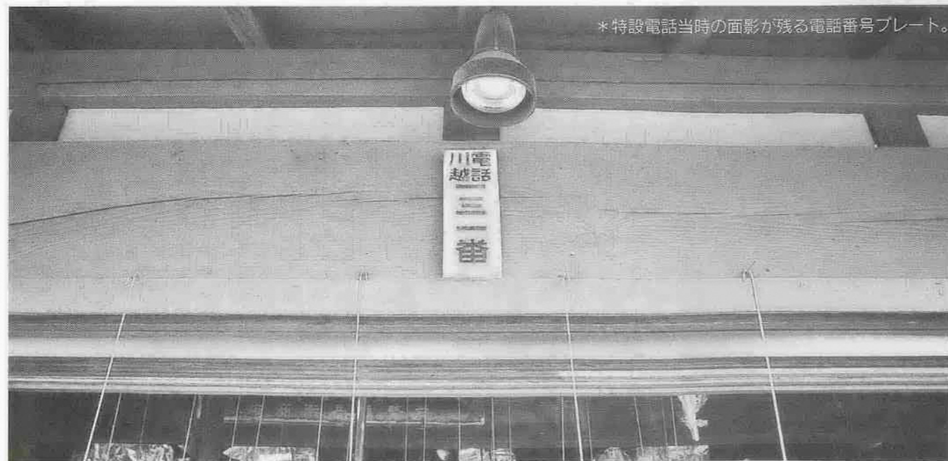
*特設電話当時の面影が残る電話番号プレート。

*0492地域は川越市のほか上福岡市・坂戸市・鶴ヶ島市・富士見市(一部)・川島町・鳩山町・毛呂山町・越生町・大井町・三芳町です。