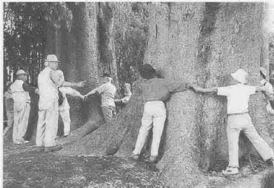
手をつなぎながら幹の大きさを実感（下小坂の大ケヤキ）

緑のまぶしい季節。川越市内にある大きな樹木を訪ね、自然とのかわりを考えます。地域を見守り、長い時の流れを生きてきた樹木は、私たちの心をいやしてくれる存在であるように感じます。