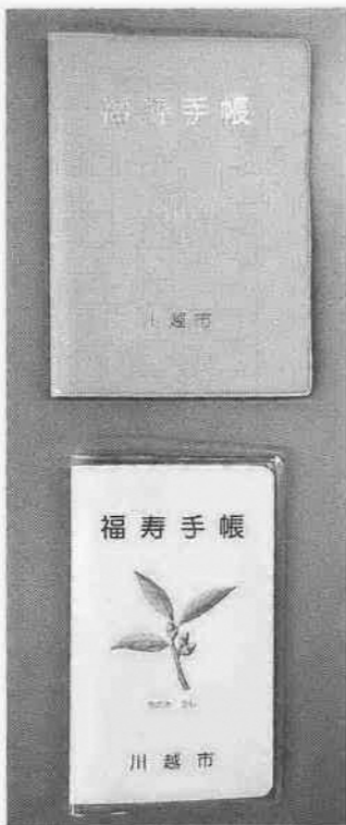
下が新しい福寿手帳。どちらも使えます

お、従来の福寿手帳もこれまでどおり使用できます。 配布窓口：高齢者いきがい課（総合保健センター内）・介護保険課（市役所本庁舎一階）・出張所・連絡所・後案会館 持ち物：住所・年齢が確認できるもの（保険証等） 問い合わせ：高齢者いきがい課 いきがい係 ☎29・4120