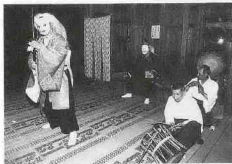
中福の神楽 （市指定・無形民俗文化財） 春の祈とうとして中福稻荷神社に「神楽」が奉納されます。日が暮れるころ、木々に囲まれた境内の神楽殿にともる電球。舞台では、淡々と「やまたのおろち」「かんだたねまき」などが繰り広げられ、豊作を祈る里神楽ののどかな雰囲気を感じることができます。衣装、面などの神楽用具もまた市指定文化財になっています。