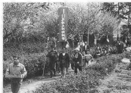
芳地戸のふせぎ (市指定無形民俗文化財)

笠幡の尾崎神社で春分の日に行われる悪魔払いの行事。午前中に「みこし」と「辻札」を作り、午後に神社で祈とうの後、太鼓を鳴らしながら地区の各家を回ります。地区境には、疫病や魔物を防ぐための「辻札」が立てられますが、「みこし」といっしょに回る子どもたちの元気な姿が、いちばんの「悪魔払い」に思えます。