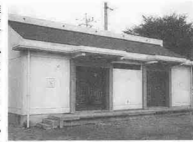
川越市災害備蓄庫（南台3丁目）

現在、川越市内には十二か所に災害備蓄庫が設置されています。これは、食糧や生活必需品等の救援物資と給水用その他の資材等を備蓄するために、市が昭和五十四年から順次整備したものです。