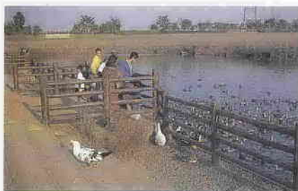
川越の景観100から「小畔水鳥の郷公園」