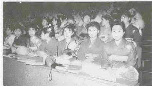
今年1月15日に行われた成人式(市民会館)

来年一月十五日に成人式を迎える皆さん、人生の一つの節目を迎えるにあたり、皆さんの主張や将来への抱負、希望をつづつてみませんか。 新世紀に向かって生きる「二十歳の自分」を描けるのは、あなた自身だけです。 対象：昭和四十九年四月二日から昭和五十年四月一日までに生まれた市内在住の方 内容：生涯学習、国際化、高度情報化、高齢化などが進む社会にあって、私はこう生きたい、こう考える 字数：B4判四百字詰め原稿用紙五枚以内(住所、氏名、生年月日、電話番号を明記) 提出：十二月十三日(火)(郵送の場合は十三日消印有効)まで