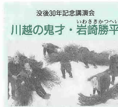
「焚木はこび」(国立近代美術館蔵)

市民文化課 ☎内線2413 日時：11月11日～12月16日、毎週金曜日、午後7時～8時30分 会場：南公民館 対象：市内在住か通勤の方 定員：先着三十人 経費：二千円 申し込み：11月1日(火)、午前9時から市民文化課(電話可)