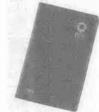
外装は緑色のビニールレザー

平成七年用の埼玉県民手帳を頒布します。埼玉県および県内各市町村の主な統計資料や官公