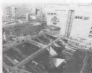
「川越いま、むかし」より