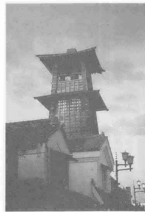
上写真=観光一般の部・最優秀賞「時の鐘」 右写真=春まつりの部・最優秀賞「南京玉すだれ」