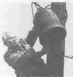
「火の見櫓のある風景」から