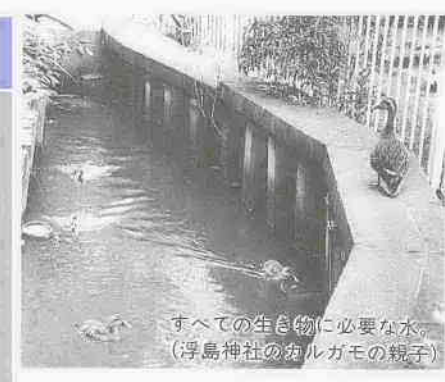
すべての生き物に必要な水 (浮島神社のカルガモの親子)