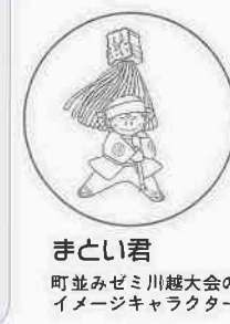
まとい君 町並みめぐり川越大会のイメージキャラクター