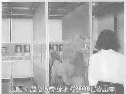
原画4点と切手およそ2000種を展示

川越西郵便局(小室22-1)の開局にあわせて7月5日(月)と6日(火)の2日間、同局の1階ロビーで切手原画と切手のミニ展覧会が開かれました。訪れた方は、新しい郵便局に「広くて、きれい」と感心する一方、偶然目にしたふらふらと切手の原画や主に市内のコレクターが所蔵する珍しい切手にも熱心に見入っていました。