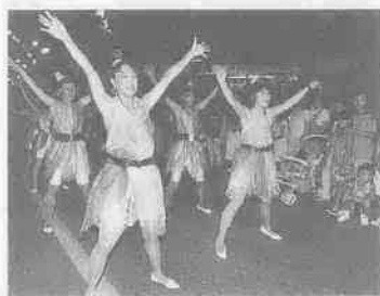
昨年のふれあいサンバ