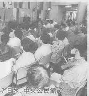
7月7日水、中央公民館で