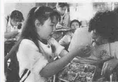
▲本番前のひととき。約70人のボランティアが、200人の出場者を陰で支える。