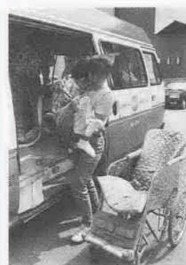
▲先生といっしょに。▼ワゴン車から車イスに乗り換えて。