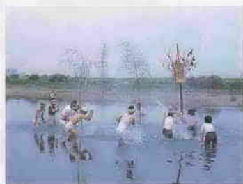
上寺山のまんぐり