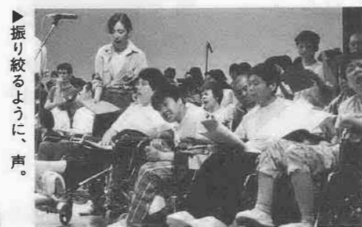
▲振り絞るように、声。