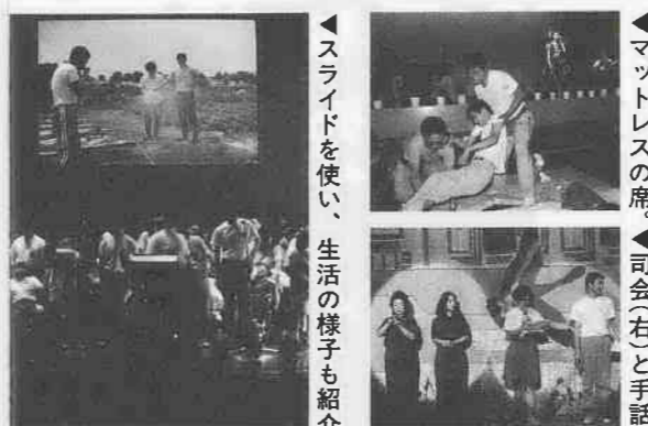
▲マットレスの席。▲司会者と手話。

障害のある人となない人がいっしょにステージに立ち、共に音楽を楽しむ「第七回みんな輝けコンサート」(同実行委員会主催)が、六月十三日(日)、市民会館で開催。美しいハーモニ、夢の調べ、「働いているんだうれしいよ 胸の辺りでずんずん音がして 涙が出るよ ことばにならない」の合唱など、十三団体、約二百人が、自慢の「歌声」を約千人の観衆に披露しました。 このコンサートの目的は、次の三つ。音楽を通して、①障害を持つ人への理解を広げてゆこう②障害を持つ人も持たない人も心の豊かさを取り戻そう③障害者自身も楽しもうというもの。今回は、民間企業で働く障害者を持った人たちの問題、夢などが取り上げられました。