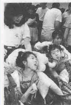
舞台監督(右上)の指揮で、本番さながら。