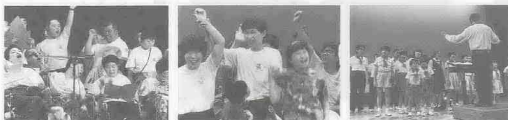
▲紹介され、大きな声で応える。▲喜びを体いっぱいに表示。▲みんなで声をそろえて。