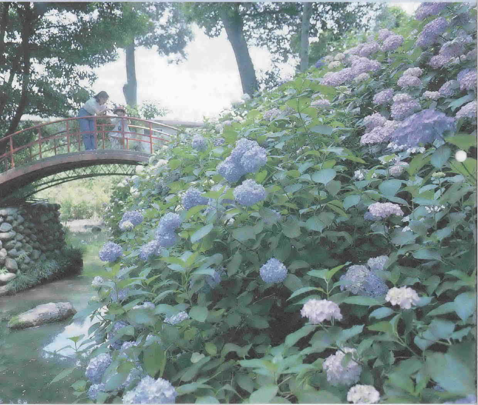
喜多院・葵庭園のあじさい（小仙波町1）