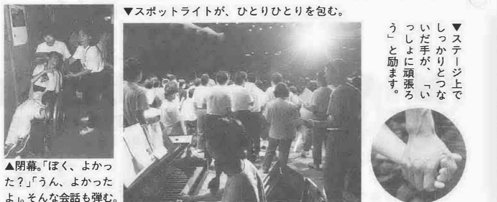
▼スポットライトが、ひとりひとりを包む。