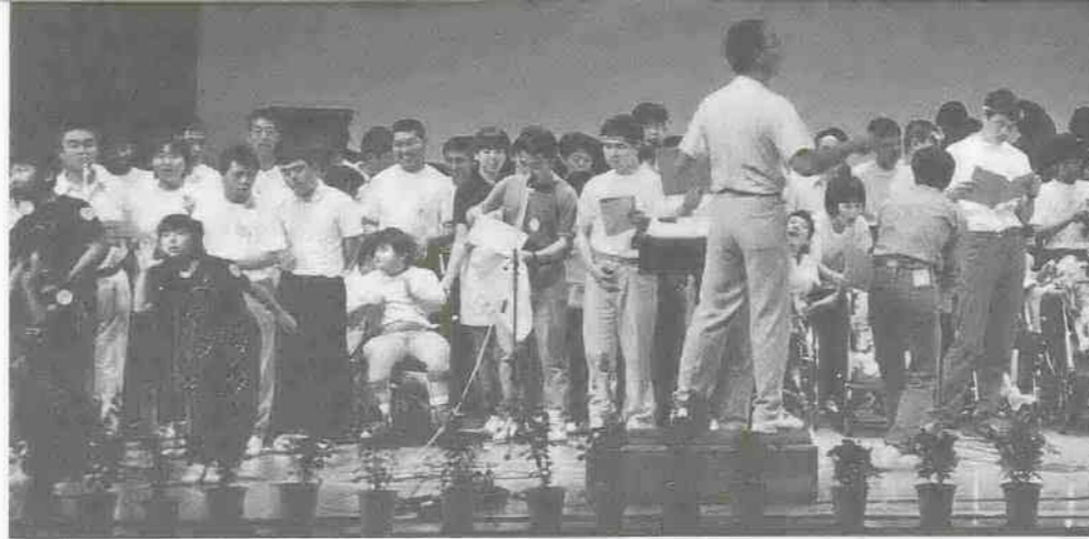
▲8団体が集まった「構成詩」。社会で働く仲間の現実、母の思い、将来の夢を発表した。