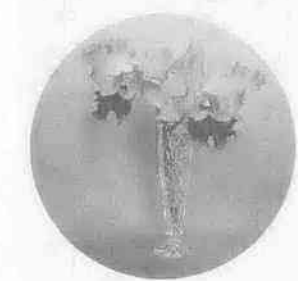
花の美しさ。街中に広がって欲しい……。

だき、他の不燃ごみとは別にして集積所へ。こんな小さな協力が、ごみ処理にとって大きな力を発揮していくのです。