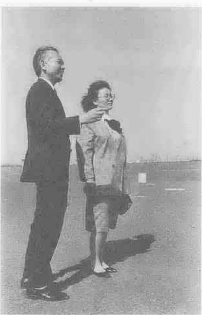
埋立地の底まで降りて説明を受ける。「ごみが減れば、ここも永く使える……。」こんな思いも湧いてくる。

雨宮 この施設がどのくらいの期間使えるか気になります。 原田 設計のうえでは十八年間となっています。ただ、ごみの搬出が五年間で六割、特にこの二二年間で八割と増加している