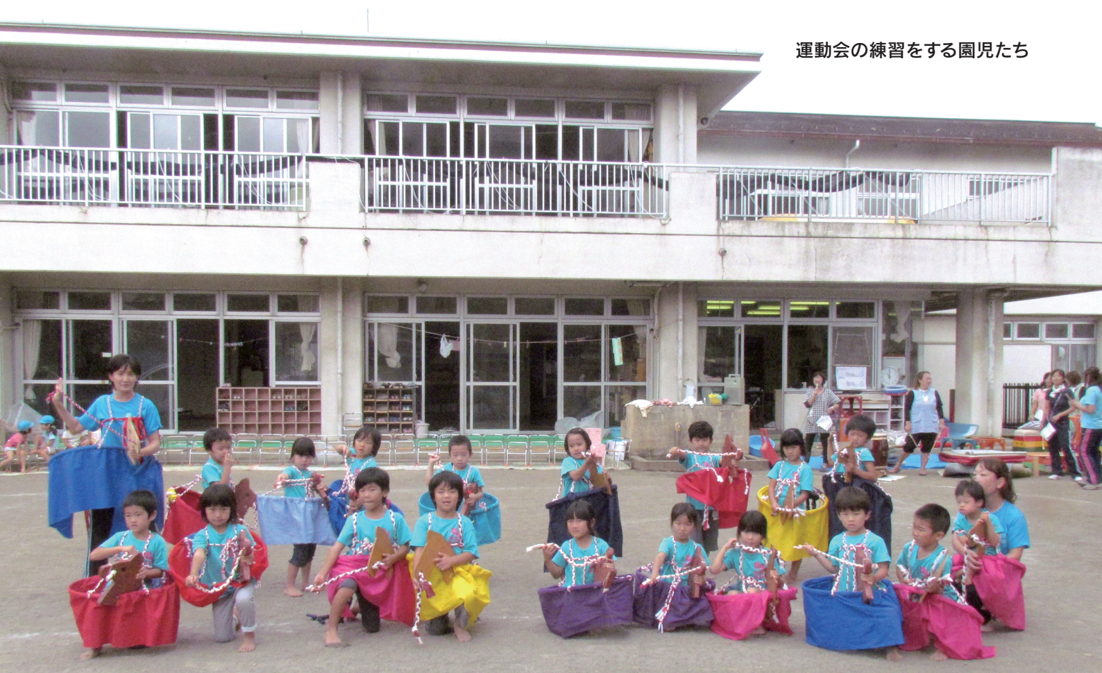
運動会の練習をする園児たち